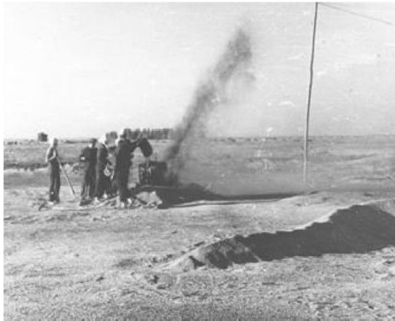
Зерноплуж иногда работал