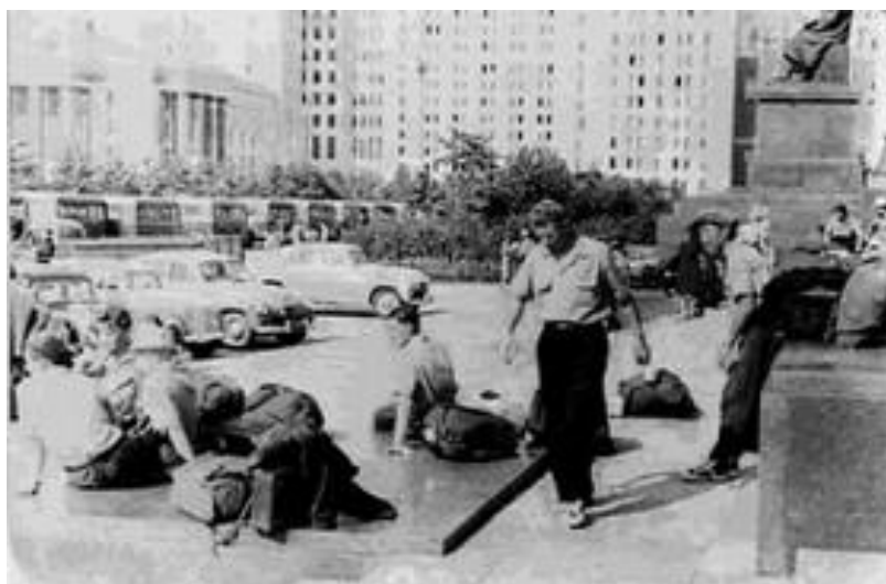
Собираемся перед химфаком в ожидании автобусов

Студенты, собрав в рюкзаки и сумки нехитрое снаряжение, собрались 19 июля около химфака в ожидании автобусов на вокзал.