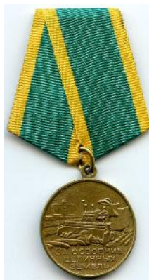
Значок и медаль «За освоение целины»

Потом были нормальные пассажирские вагоны, не очень долгая дорога в Москву. В поезде обсуждалось, чем можно себя порадовать в столице. Первое