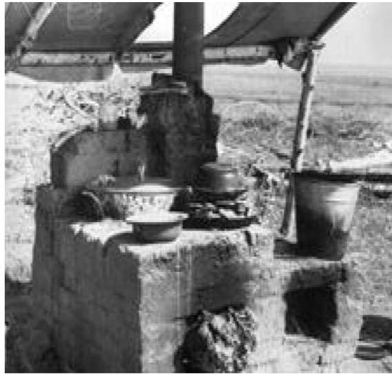
Печь из необожженной глины ни разу не подвела