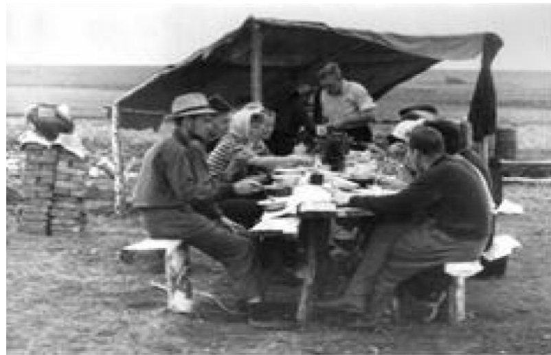
И автозагрузка, и почти английский клуб.